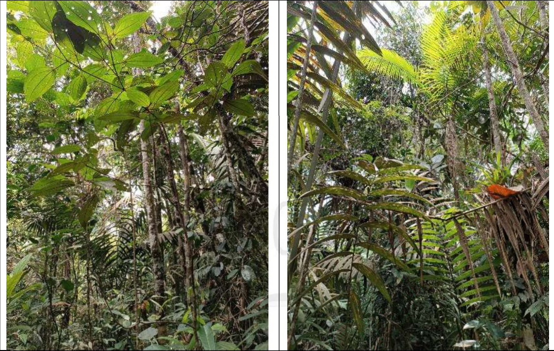
Imágenes 2, 3, 4 y 5 condiciones actuales del predio

25.4 Adicionalmente en vista satelital se observa que, el predio se encuentra en cobertura boscosa se anexa track del recorrido por partes del predio. (Ver imágenes 7)