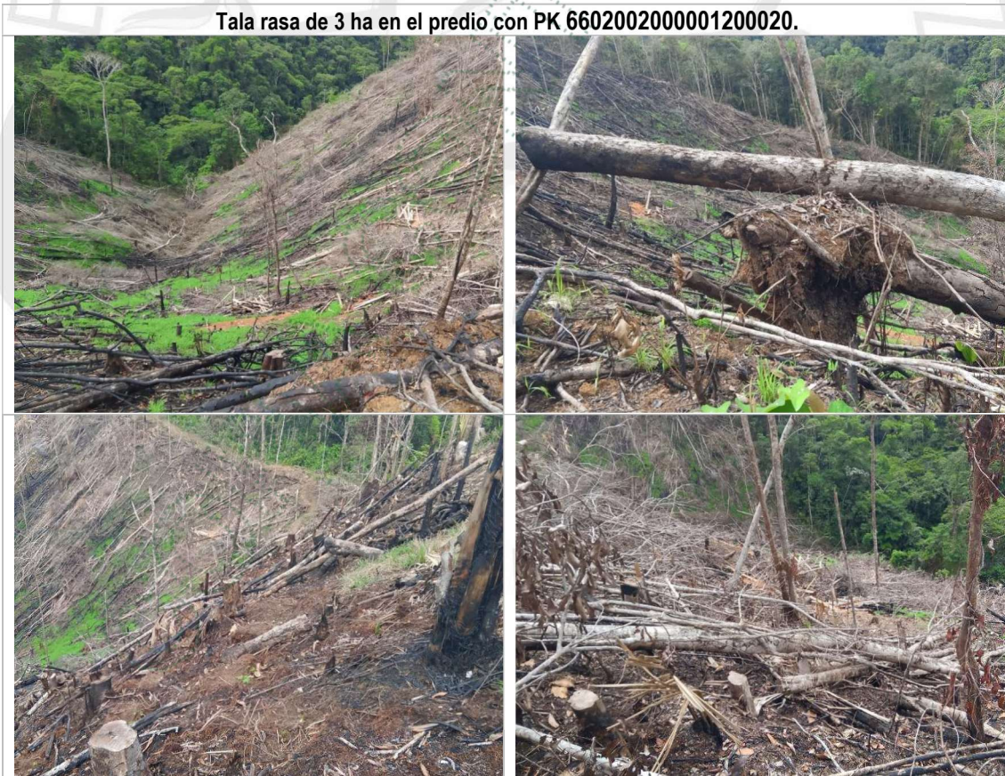
Tala rasa de 3 ha en el predio con PK 6602002000001200020.