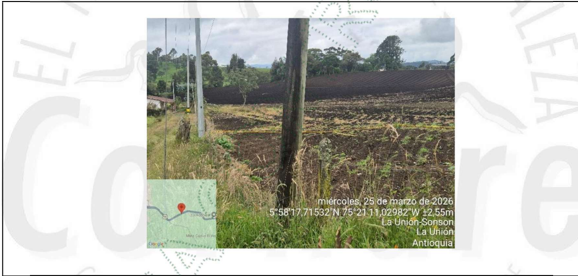
Fotografía 3. Vista general del lote y corredor vial, confirmando la no materialización del campo de infiltración de 60 m 2 aprobado. (25/03/2026)