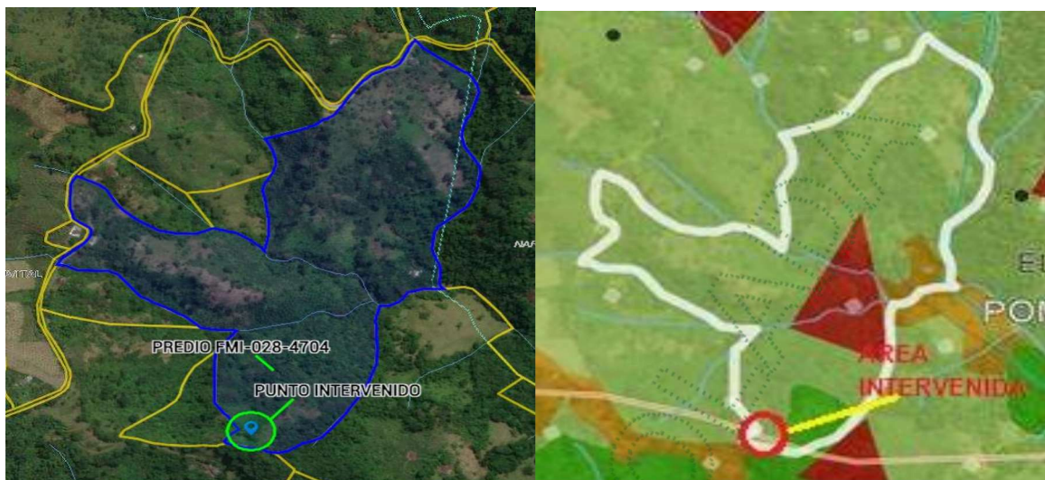
Ubicación de la zona intervenida dentro del predio.

De acuerdo a las coordenadas tomadas en campo y comparadas con el Geoportal Corporativo, la intervención se realizó en Área de Restauración Ecológica – POMCA, donde se deberá garantizar una cobertura boscosa de por lo menos el 70% en cada uno de los predios que la integran; en el otro 30% podrán desarrollarse las actividades permitidas en el respectivo Plan de Ordenamiento Territorial (POT) del municipio de Nariño, así, como los lineamientos establecidos en los Acuerdos y Determinantes Ambientales de Cornare que apliquen.