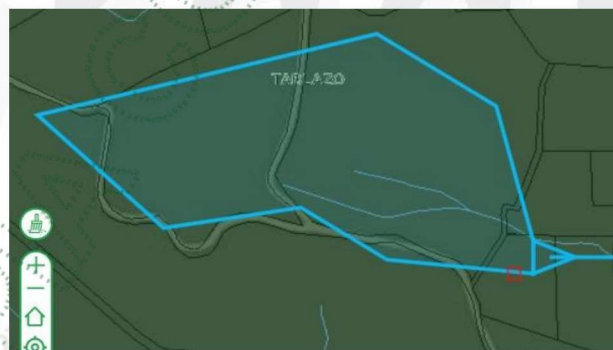
Imagen 3. Área de captación

3.9. El área de captación de la fuente se calcula con el Geoportal interno de la Corporación utilizando dos (2) variables: Distancias aguas abajo de 100 metros y radio de reubicación de 30 metros donde se implementó el método Cenicafé, dando un área aproximada de 6.2Ha.