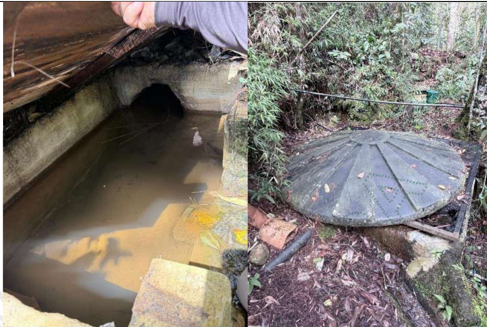
Tubería concreto a tanque de captación