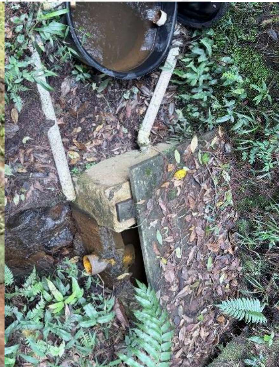
Tanque de captación