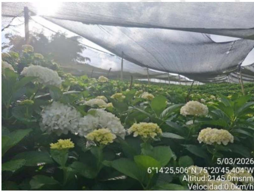
Imagen 1. Cultivo de hortensia

Así mismo, dentro del predio se evidencia una edificación destinada originalmente a vivienda, la cual actualmente se encuentra adecuada para el desarrollo de actividades administrativas (oficina) y para el manejo de labores de poscosecha del cultivo, donde se realizan actividades asociadas a la clasificación y acondicionamiento del producto.