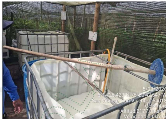
Imagen 5. Tanque de almacenamiento

3.6 De acuerdo con la consulta realizada en el Geoportal Corporativo, se evidencia que el predio objeto de evaluación se localiza dentro del área de influencia del POMCA del Río Negro, aprobado mediante la Resolución 112-7296-2017 del de 21 de diciembre de 2017.