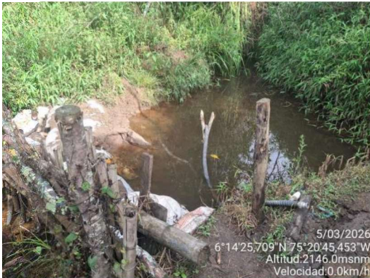
Imagen 4. Punto de Captación

De acuerdo con la información suministrada en campo, la captación se realiza mediante un sistema de bombeo con motobomba de aproximadamente dos (2) caballos de fuerza, la cual impulsa el recurso hídrico hacia el sistema de almacenamiento o distribución dentro del predio. Esta labor se realiza 4 veces por semana durante 30 minutos aproximadamente.