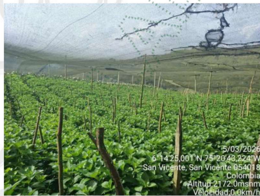
Imagen 2. Área de cultivo

3.4 El uso del recurso hídrico solicitado se encuentra asociado principalmente a las necesidades de riego del cultivo, para las actividades domésticas este es suministrado por el acueducto rural San Antonio.