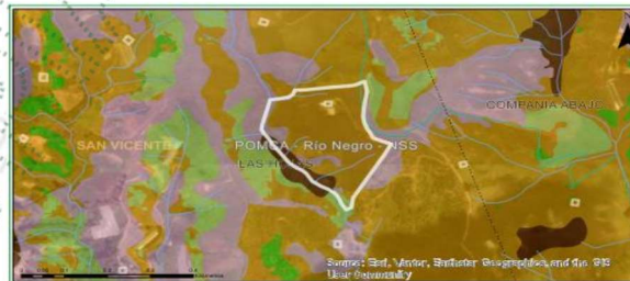
Imagen 6. Determinantes ambientales.

Así mismo, mediante resolución 112-4795-2018 (8 de noviembre de 2018) se establece el régimen de usos al interior de la zonificación ambiental del POMCA del Río Negro, define los usos permitidos para cada subzona de interés.