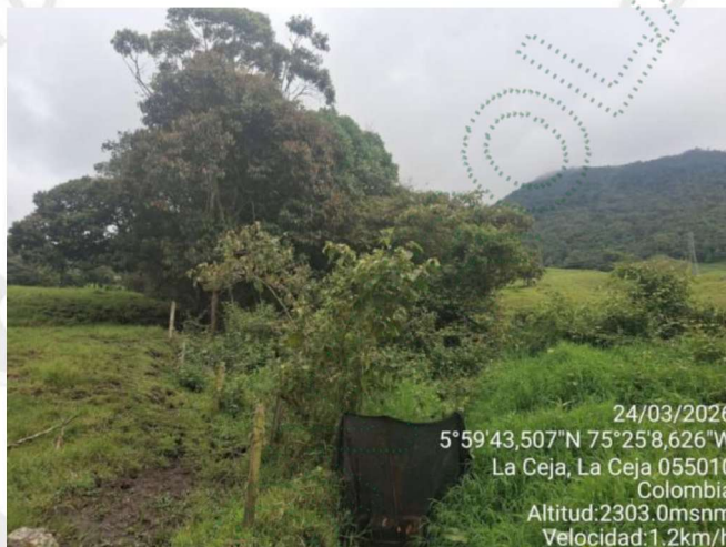
Imagen 8. Protección de los recursos en punto de captación.

El área presenta un estado de conservación regular de los recursos naturales, se observó un entorno intervenido por ganadería extensiva, caracterizado por la presencia de potreros con cobertura de pastos y evidencias de pisoteo del suelo, lo que puede generar procesos de compactación y erosión. En medio de estos se conserva un parche de vegetación secundaria o relicto de bosque, asociado a la fuente hídrica, el cual presenta cobertura arbórea y arbustiva que contribuye a la protección local del recurso.