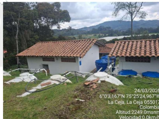
Imagen 6. Planta de Potabilización.

3.8 De acuerdo con la consulta realizada en el Geoportal Corporativo, se observa que el predio objeto de evaluación se localiza dentro del área de influencia del POMCA del Río Negro, aprobado mediante la Resolución 112-7296-2017 del 21 de diciembre de 2017.