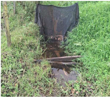
Imagen 3. Punto de captación