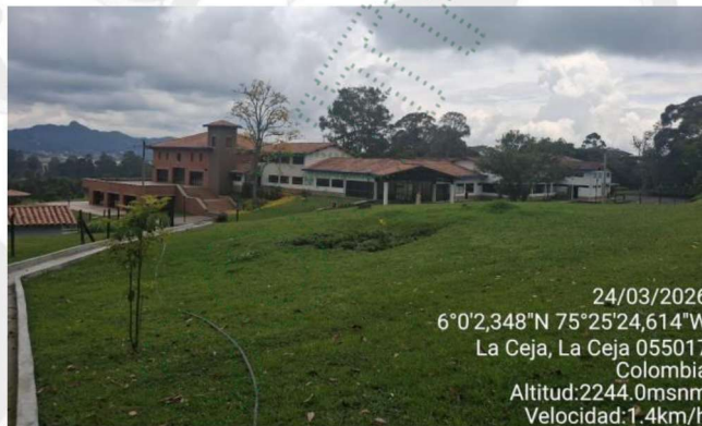
Imagen 1. Predio de interés.