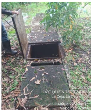
Imagen 5. Tanque de Desarenador

3.7 Para el aprovechamiento del recurso hídrico, la Fundación Monte María cuenta con una obra de captación artesanal, un tanque de almacenamiento primario, red de distribución, planta de potabilización, tanque desarenador y tanques de almacenamiento. Uno de estos tanques está destinado exclusivamente para uso del Cuerpo de Bomberos Voluntarios, en caso de presentarse situaciones de emergencia por incendio.