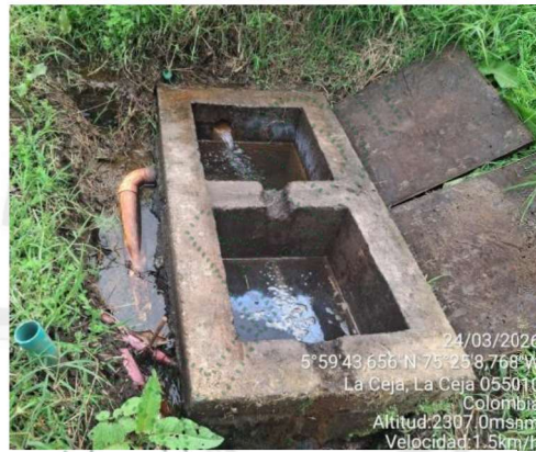
Imagen 4. Estructura en concreto

3.7 Para el aprovechamiento del recurso hídrico, la Fundación Monte María cuenta con una obra de captación artesanal, un tanque de almacenamiento primario, red de distribución, planta de potabilización, tanque desarenador y tanques de almacenamiento. Uno de estos tanques está destinado exclusivamente para uso del Cuerpo de Bomberos Voluntarios, en caso de presentarse situaciones de emergencia por incendio.