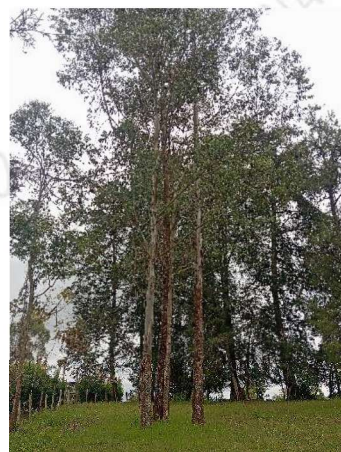
Imágenes 3, 4, 5, 6, 7. Árboles a intervenir