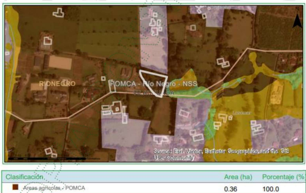
Imagen 2. Determinantes predio de interés

Localización de los árboles aislados a aprovechar con respecto a Acuerdos Corporativos y al Sistema de Información Ambiental Regional: De acuerdo con el Sistema de Información Geográfica de Cornare, los predios de interés, se encuentran al interior de los límites del Plan de Ordenación y Manejo de la Cuenca Hidrográfica POMCA del Río Negro, aprobado en Cornare mediante la Resolución No. 112-7296 del 21 de diciembre de 2017 y mediante la Resolución No. 112-4795 del 8 de noviembre de 2018, estableció el régimen de usos, además, por medio de la resolución RE-04227-2022 del 1 de noviembre de 2022 se modifica el régimen de usos al interior. Obteniendo para el predio de interés las siguientes áreas: Zona Áreas Agrícolas (100%), tal y como se muestra en la siguiente imagen: