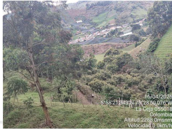
16/04/2026 5°58'21,343"N 75°28'50,076"W La Ceja 055018 Colombia Altitud: 2288.0msnm Velocidad: 0.0km/h