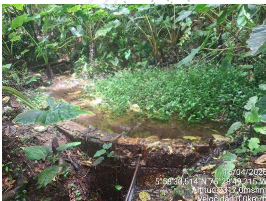
Imagen 4. Obra de captación

3.5 Se observa una obra de captación superficial de pequeña escala, consistente en una estructura en concreto dispuesta transversalmente al cauce, que actúa como un dique bajo permitiendo la acumulación de agua en un espejo reducido aguas arriba. La captación se realiza mediante una tubería instalada en la parte frontal de la estructura, operando por gravedad. No se evidencian elementos de control o pretratamiento como rejillas o desarenadores. Desde esta estructura, el recurso hídrico es conducido hacia un tanque de almacenamiento ubicado en la parte alta del predio; posteriormente, se distribuye tanto hacia la vivienda como hacia un segundo tanque localizado en el área de cultivo de aguacate.