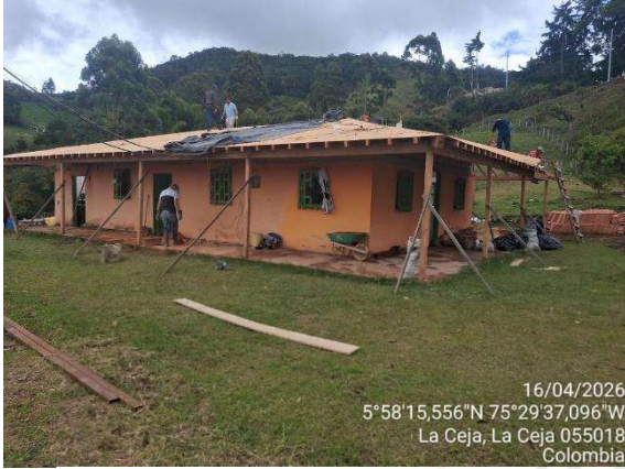
16/04/2026 5°58'15,556"N 75°29'37,096"W La Ceja, La Ceja 055018 Colombia