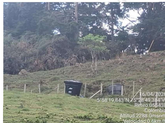
Imagen 5. Tanque de almacenamiento.