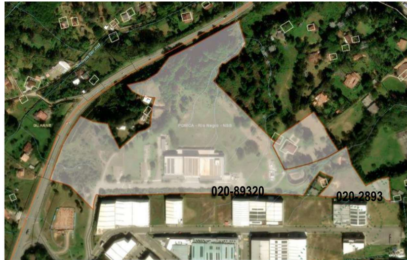
Imagen 1. Ubicación predios de interés

3.3 En cuanto a los individuos arbóreos de interés: Se encuentran en medio de coberturas de pastos limpios, asociados a las zonas verdes de la propiedad, dos de los tres presentan buenas condiciones generales pero el ultimo se encuentra seco. Durante la visita se realizó un recorrido por el área a intervenir con el fin de identificar los árboles objeto de solicitud, se tomaron puntos de ubicación geográfica y se realizaron mediciones dasométricas para la elaboración del inventario forestal. Los árboles requeridos para aprovechamiento corresponden a: