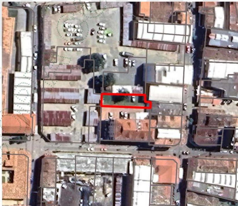
Imagen 1. Ubicación predio de interés