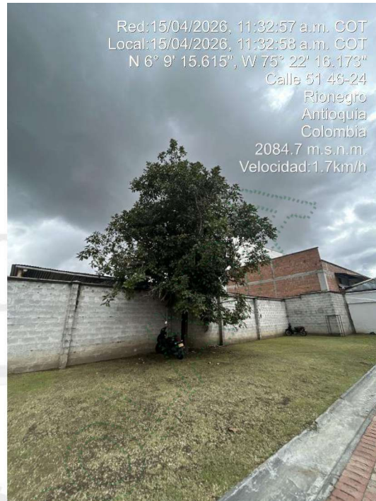
Imagen 3 y 4. Arbol a intervenir