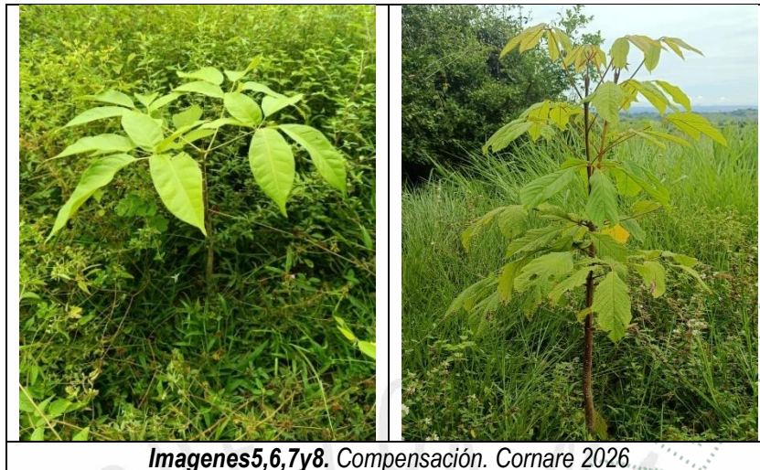
Imágenes 5,6,7y8. Compensación. Cornare 2026

Verificación de Requerimientos o Compromisos: RE-03016-2025 del 05 de agosto del 2025, por medio de la cual se autoriza un permiso de aprovechamiento forestal de árboles aislados fuera de la cobertura de bosque natural por regeneración natural