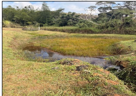
Imagen 2. Captación de aguas superficiales, El Carmen de Viboral.