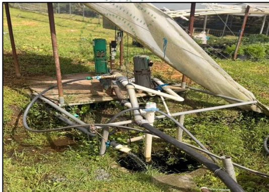
Imagen 1. Aranzalez, S.J. (2026). Captación de aguas subterráneas, El Carmen de Viboral.