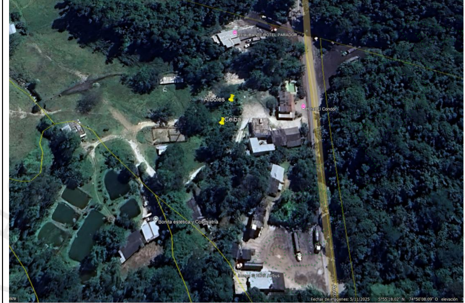
Imagen 1. Ubicación de los árboles talados dentro del predio.