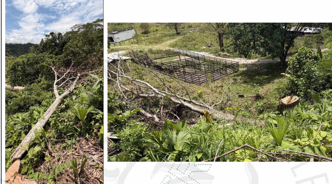
Imagen 6 y 7. Árboles aprovechados con DAP <30 cm