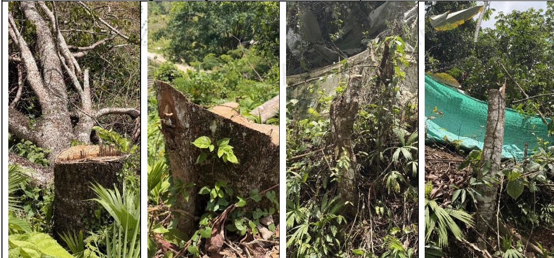
Imagen 2, 3 4 y 5. Tocones de los árboles aprovechados.