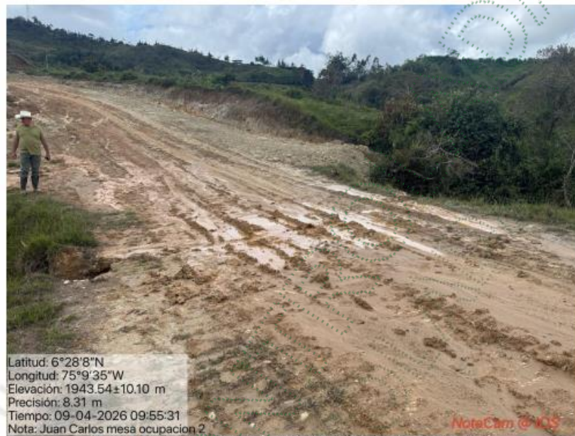
Imagen 3. Permanencia de ocupación de cauce para adecuación de vía.

Posteriormente se ubica la segunda ocupación de cauce en las coordenadas 75°9'35" y 6°28'8", la cual fue evidenciada en el informe técnico IT-01137-2025 del 20/02/2025. Allí se pudo observar que la ocupación de total del cauce de una segunda fuente hídrica sin nombre permanece. Los llenos y taludes conformados para dar continuidad a la vía se encuentran parcialmente revegetalizados, sin embargo, aguas arriba de la fuente se realizaron movimientos de tierra y llenos sobre las márgenes de dicha fuente en un tramo de aproximadamente 30 metros, interviniendo su ronda hídrica y facilitando el arrastre de sedimentos.