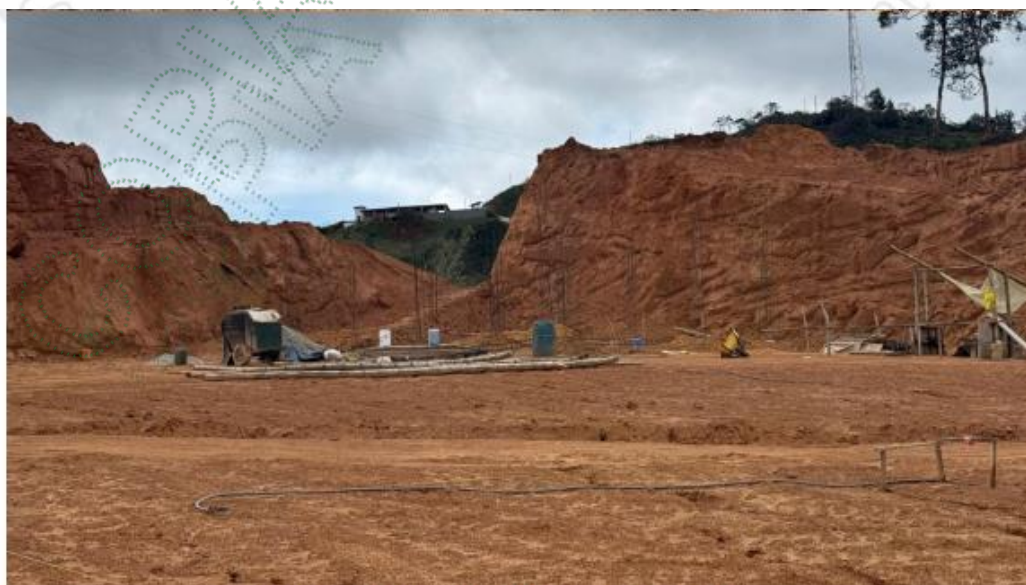
Imágenes 5 y 6. Explanación y vivienda en construcción.