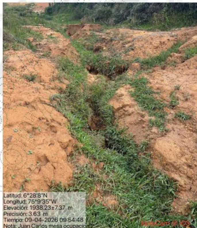
Imagen 4. Llenos antrópicos y sedimentación aguas arriba de la fuente sin nombre 2.