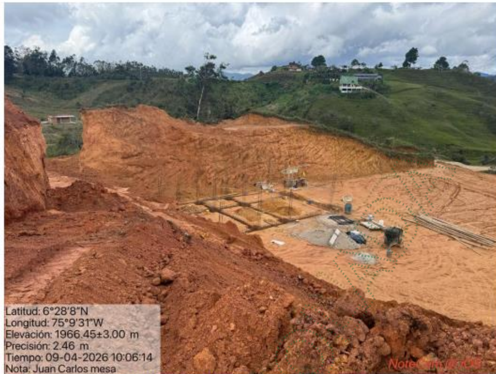
Imagen 7. Taludes generados y vivienda en construcción.