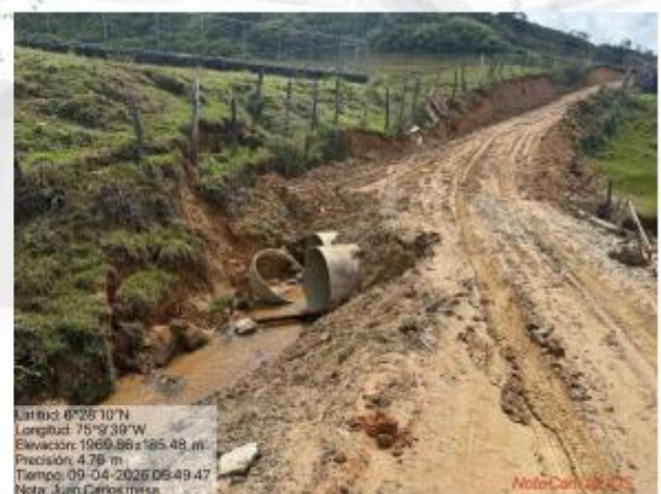
Imágenes 1 y 2. Ocupación de cauce 1.