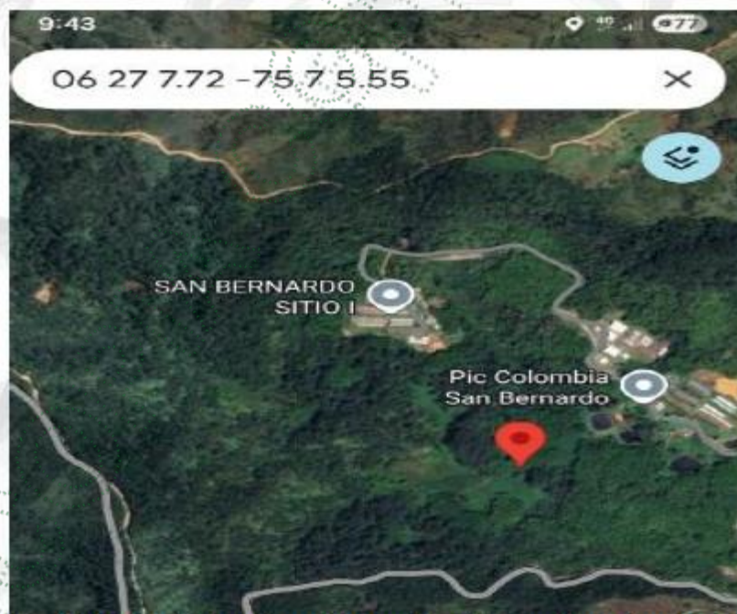
Imagen 2. Ubicación del predio según coordenadas suministradas por el quejoso

En el sitio se estableció comunicación con personal vinculado a la actividad porcícola de dicha empresa, quienes manifestaron que dentro de los predios de la empresa no se ha realizado aprovechamiento forestal, tala de bosque natural ni prácticas asociadas al descortezado de árboles, como se describe en la queja. Sin embargo, no fue posible verificar esta información de manera directa en la totalidad del predio, debido a que no se contaba con autorización de ingreso ni acompañamiento previo, condición necesaria para realizar una inspección técnica detallada al interior de las instalaciones.