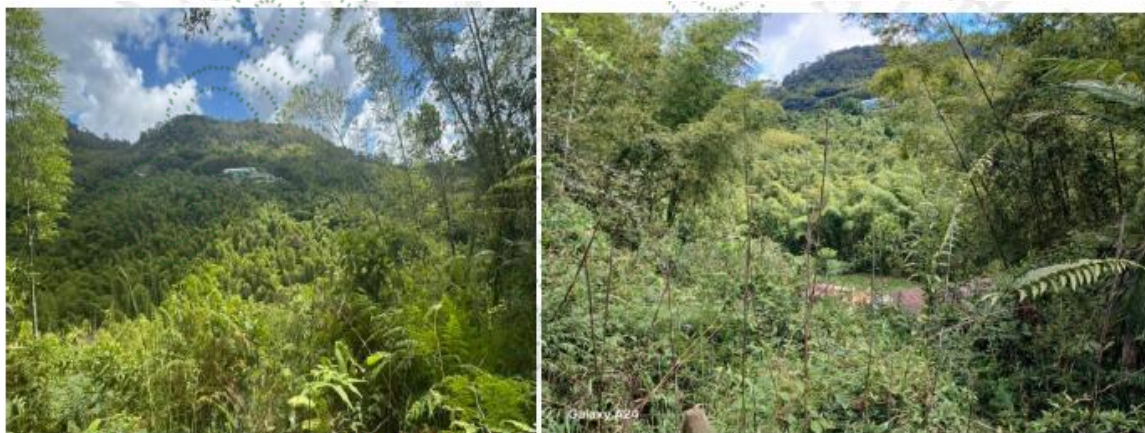
Imagen 4 y 5 evidencias del punto reportado en la queja

Durante el recorrido visual externo y con base en el registro fotográfico obtenido, se observa que el área presenta una cobertura vegetal densa, con predominio de especies secundarias, presencia de guadua y vegetación arbustiva en diferentes estados de desarrollo, sin evidenciarse de manera clara intervenciones recientes como tala rasa, socola intensiva o descortezado de árboles en el área visible desde los puntos accesibles. No obstante, esta apreciación corresponde únicamente a las zonas observadas externamente, por lo cual no es concluyente frente a la totalidad del predio o a sectores que no pudieron ser inspeccionados.