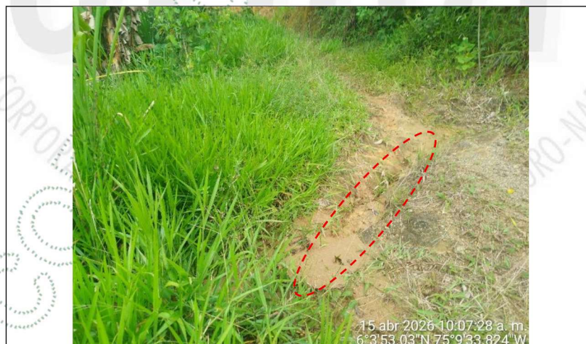
Figura 7. Canal de evacuación de las aguas lluvias en el sitio

25.4 En el lugar se identificó un desnivel en el terreno, que cumple la función de cuneta para la evacuación de las aguas lluvias del sitio intervenido, con lo cual se ha evitado la migración de sedimentos a la fuente por acción de escorrentía. Además, el señor Edgar Quintero manifestó que, el área donde se había depositado la tierra removida se le sembró semilla de pasto de la especie Brachiaria spp , para el control de procesos erosivos y retención del material suelto.