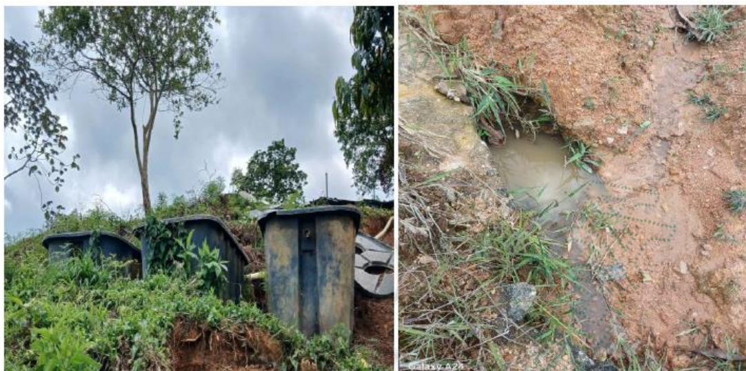
Imagen 3,4,5 y 6 reubicación y estado actual del pozo sépticos

Al realizar la consulta de las determinantes ambientales del predio identificado con Folio de Matrícula Inmobiliaria No. 0013587 PK PREDIO 6702001000002300051, ubicado en la vereda San Matías del municipio de San Roque, se estableció que el mismo no presenta determinantes ambientales