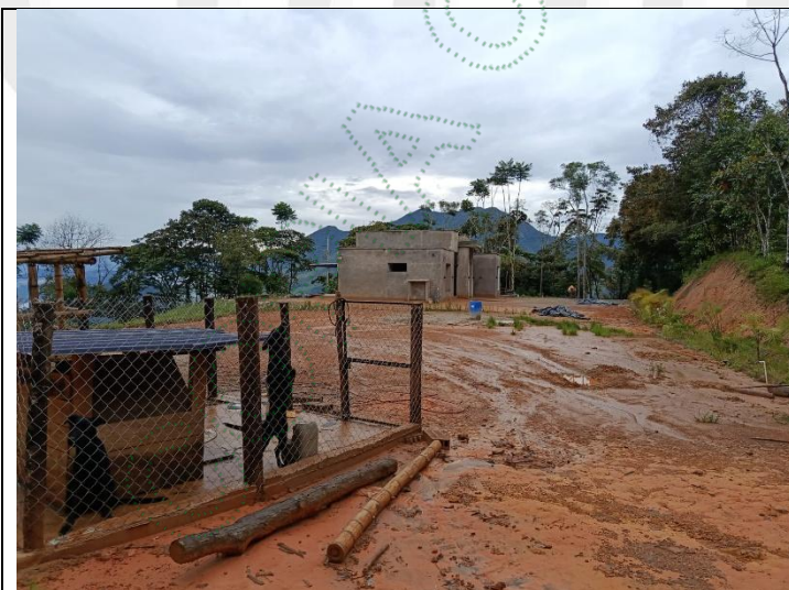
Imagen 3. Casa en construcción