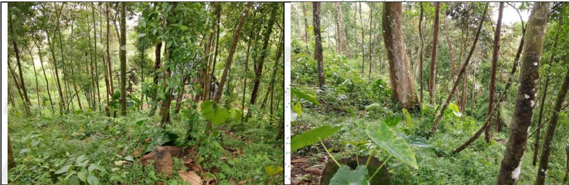
Imagen 1 y 2. Presencia de regeneración natural del bosque socolado anteriormente

25.3 En la visita del 06 de febrero del 2026, se observa que la mayor parte del área donde se realizó anteriormente la socola del bosque se encuentra en regeneración natural, sin embargo, en una pequeña parte se sembró con algunos frutales para el consumo personal y forestales de abarco.