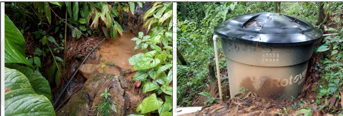
Imagen 5. Captación del agua

25.10 Las áreas asociadas a las fuentes hídricas se encuentran conservadas.