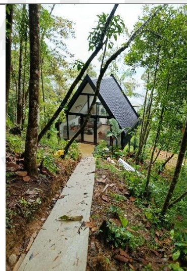
Imagen 4. Casa en materiales livianos