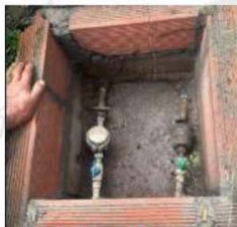
Medidor de Consumo