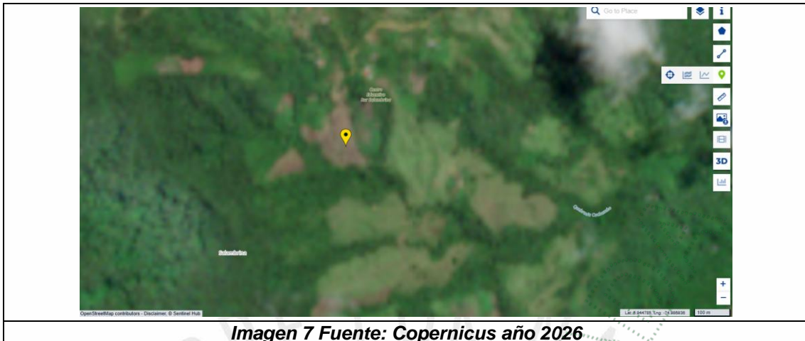
Imagen 7

25.4 Se realiza a continuación la verificación, con respecto a los requerimientos que estableció la Corporación, en la siguiente actuación administrativa: