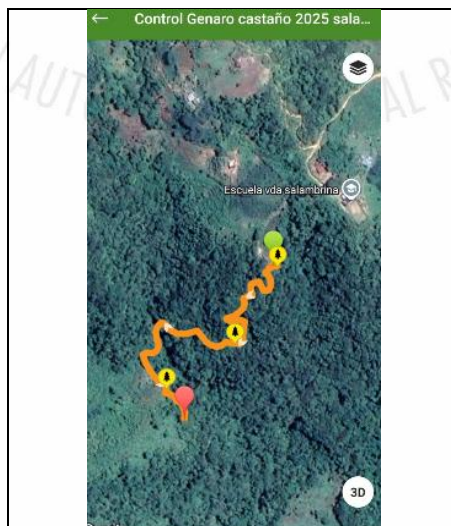
Imágenes 6 Track del recorrido y vista satelital fuente: Wikiloc.

25.3 La verificación realizada mediante el análisis del track georreferenciado del recorrido y la interpretación de imágenes satelitales correspondientes al año 2026 (Fuente: Copernicus) permitió confirmar la estabilidad de la cobertura antrópica existente y la ausencia de procesos de regeneración natural asistida. De igual manera, se estableció que la intervención se circunscribió al área inicialmente reportada, sin evidenciarse ampliación de la frontera agrícola hacia sectores de bosque conservado o áreas adicionales de cobertura natural. (Ver imágenes 6 y 7)