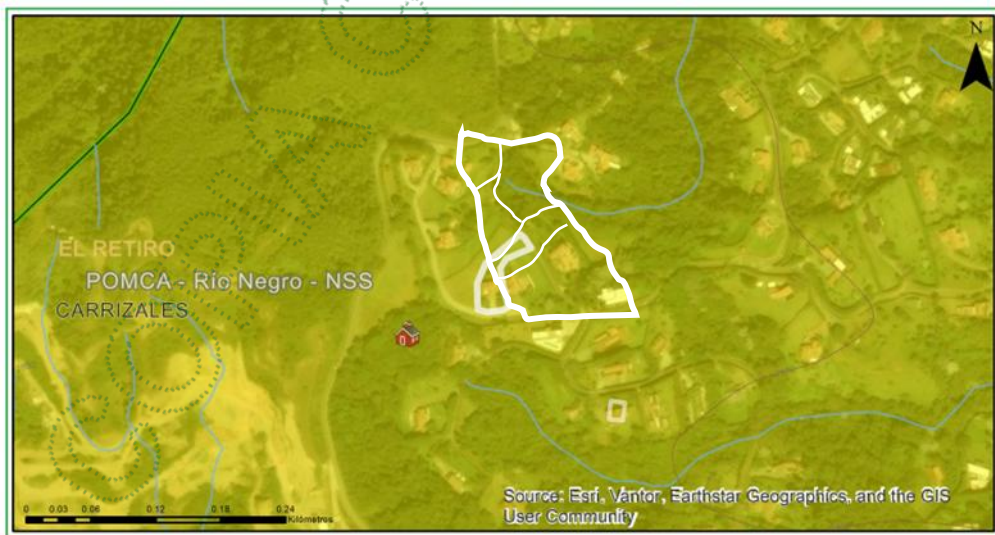
Figura 2. Categoría de suelo restringido POT – Polígono de Parcelación

3.4 De conformidad con las determinantes ambientales, en la categoría de suelo restringido definido en el POT, el CONDOMINIO MIRADOR DE SAN SIMÓN se encuentra en su totalidad dentro del polígono definido para parcelaciones, como se muestra de manera general la