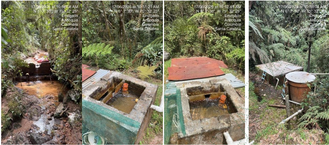
Punto de Captación

derivación. Seguidamente se localizan los tanques de almacenamiento y retorno de caudal a la fuente. La descripción de la captación y las unidades que conforman el sistema se muestran en las fotos a continuación.