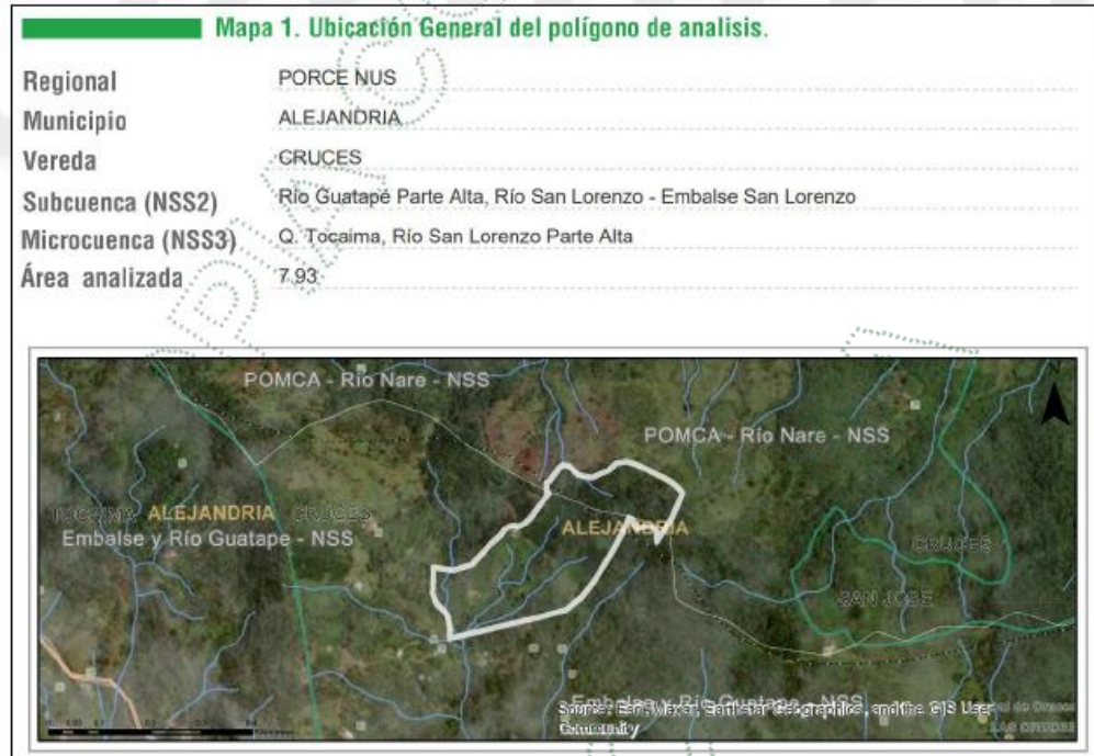
Imagen 1. MapGIS Cornare. 2025. Localización del predio con cédula catastral No. 0212001000000800033.