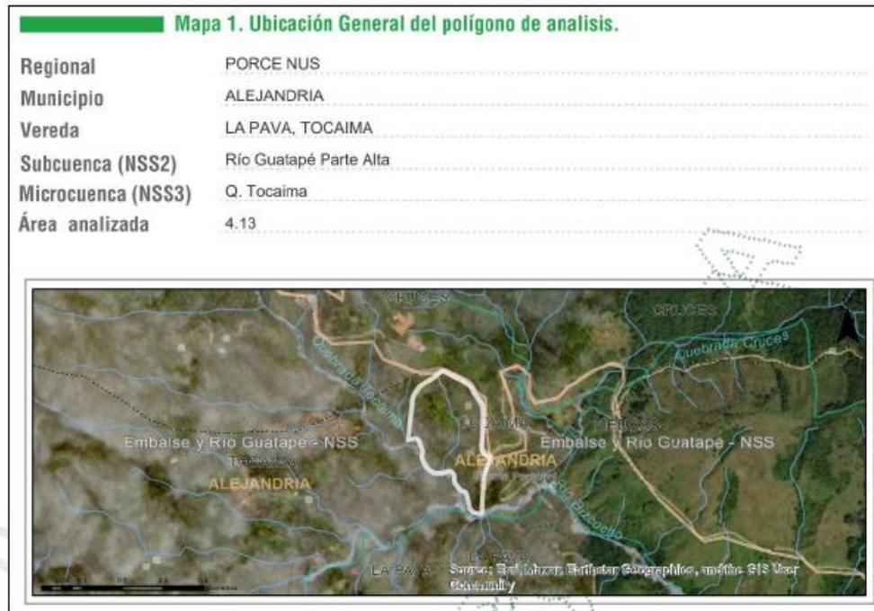
Imagen 1. MapGIS Comare. 2025. Localización del predio con cédula catastral No. 0212001000000700002.