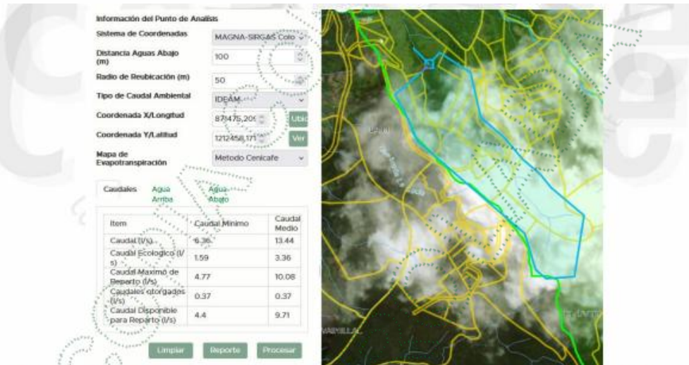
Imagen 3. Tomada del Geoportal Mappgis. Verificación del caudal mínimo disponible de reparto de la Fuente Hídrica.