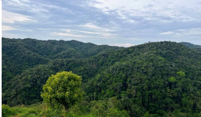
Bosque aprovechado en el marco del permiso de aprovechamiento.

25.2 Se procedió a realizar un análisis de imágenes Sentinel-2 a través de la plataforma Copernicus, con el fin de evaluar cambios en la cobertura boscosa entre enero de 2024 hasta la actualidad (Figura 2), constatando que no se detectaron frentes de deforestación significativos, no obstante, a partir del mes de mayo de 2026 se evidencia claros dentro y fuera de la unidad de corta.