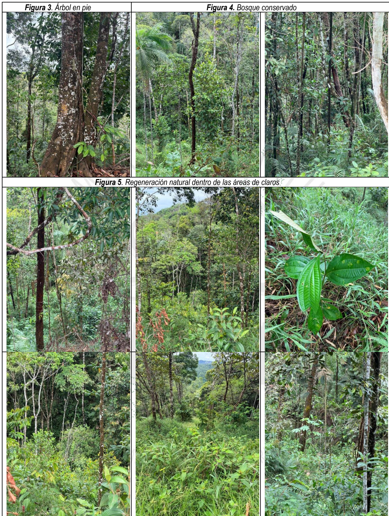
Tabla 3. Verificación de requerimientos