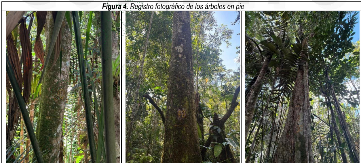
Figura 4. Registro fotográfico de los árboles en pie

25.6 Igualmente, se observó regeneración natural en los sectores intervenidos por el aprovechamiento forestal. No obstante, pese a la permanencia de la cobertura boscosa, algunas áreas del bosque remanente presentan un alto nivel de perturbación, evidenciado por la apertura del dosel. (Figuras 5 y 6).