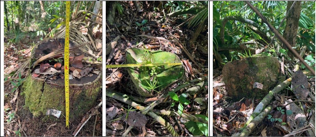
Figura 8. Residuos del aprovechamiento.