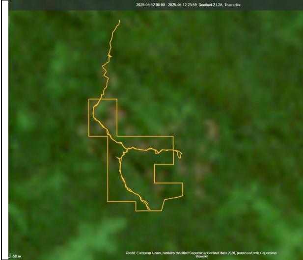
Figura 3. Imagen satelital del predio.

Fuente: Copernicus, imagen del 12 de mayo de 2025