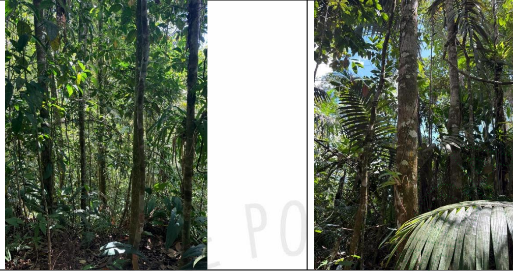
Figura 6. Presencia de regeneración natural en las áreas donde realizó el aprovechamiento