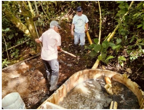
Imágenes relacionadas con el retiro de las natas.