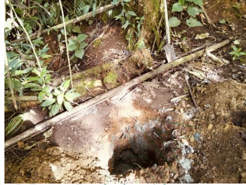
Imágenes relacionadas con la inoculación del F.A.F.A.