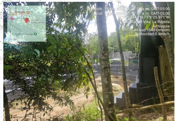
Imagen 5 y 6 . Inicio de la afectación Cornare 2026