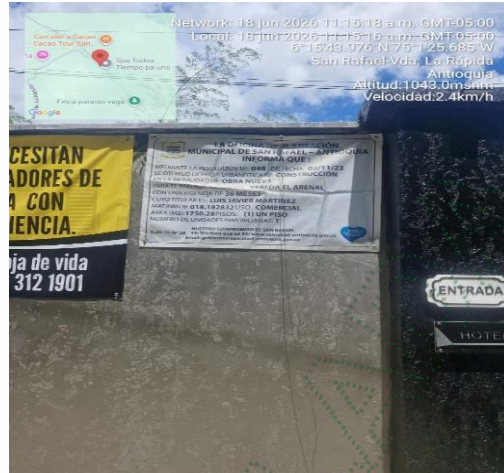
Imagen 3 Ubicación Predio Google maps 2026 licencia urbanística Cornare 2026