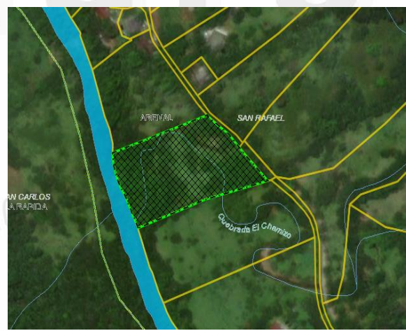
Imagen 2 Localización predio Cornare 2026

Una vez se llega al sitio de las obras se evidencia que sobre la fuente hídrica “El Chamizo” y su ronda hídrica han generado modificaciones en las condiciones naturales del cauce, evidenciándose alteraciones en la morfología del terreno asociadas a la conformación de llenos