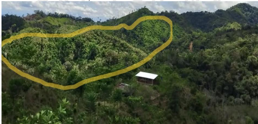
Imagen 2. Panorámica tomada desde el mismo punto el día de control y seguimiento de las condiciones ambientales del área intervenida mayo del 2026.