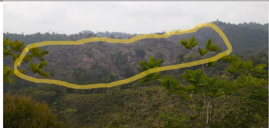
Imagen 1. Panorámica tomada desde el mismo punto el día de atención a la denuncia ambiental en abril del 2024, del área intervenida.