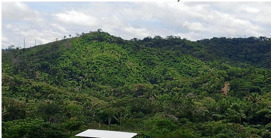
Imagen 3. Registro fotográficos de las condiciones ambientales del área intervenida en abril del 2024.