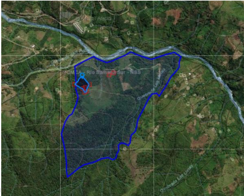
Imagen 1. Ubicación del punto de intervención con respecto al predio FMI 028-24856.