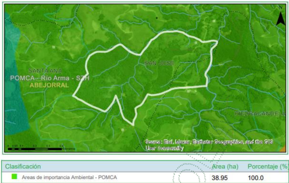
Imagen 2: Determinante ambientales del predio.

Según la zonificación ambiental del predio de interés, las condiciones propias de uso para los mismos son: Áreas de importancia Ambiental: Se deberá garantizar una cobertura boscosa de por lo menos el 70% en cada uno de los predios que la integran; en el otro 30% podrán desarrollarse las actividades permitidas en el respectivo Plan de Ordenamiento Territorial (POT) del municipio, así, como los lineamientos establecidos en los Acuerdo y Determinantes Ambientales de Cornare que apliquen. La densidad para vivienda campesina será la establecida en el POT y para la vivienda campestre será de tres (3) viviendas por hectárea.