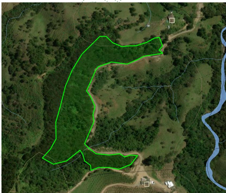
Imagen 2: Área de la tala.

El área de intervención corresponde a 2.45 hectáreas, en la cual fueron talados aproximadamente 450 árboles de Pino Patula ( Pinus patula ) y 12 árboles de Pino Ciprés ( Cupressus lusitanica ). Los individuos talados corresponden a ejemplares maduros de su especie, con DAP (Diámetro a la Altura del Pecho) en promedio de 0.70 a 0.80 metros, y que no hacen parte de coberturas densas de bosque natural, correspondiendo a especies exóticas introducidas de árboles aislados.