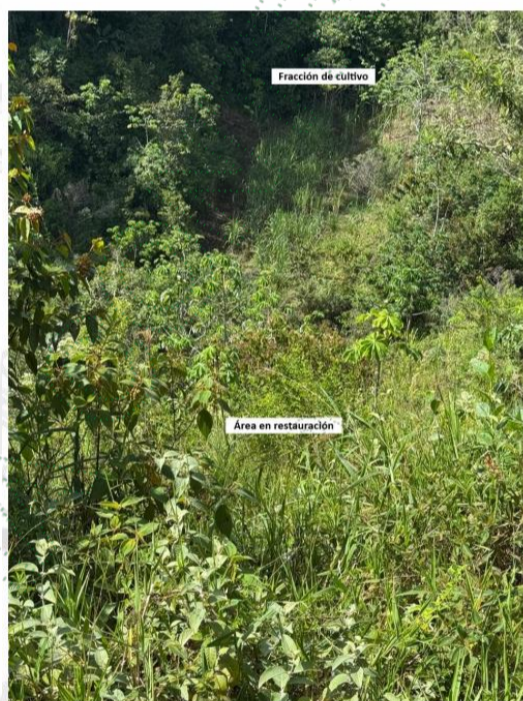
Imagen 4. Vista del lote desde la parte alta. Se evidencian fracciones de lote en cultivo de caña y otras en restauración.

Durante la inspección también se pudo observar que el tramo de la fuente hídrica Sin nombre que discurre por el predio se encuentra limpio, sin presencia de material vegetal proveniente de árboles aprovechados u otros elementos que alteren su cauce natural. Así mismo, la ronda hídrica de la fuente se destinó para restauración pasiva. En cuanto a la verificación de los requerimientos establecidos en la AU-01388-2025 del 07/04/2025 se tiene: