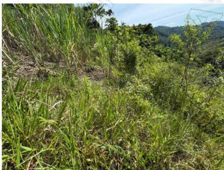
Imagen 1. Estado actual del predio.

Al llegar al sitio de interés, ubicado en las coordenadas -74^{\circ}58'14'' y 6^{\circ}25'43'' se presenta dificultad para recorrer el lote debido a la alta presencia de rastros compuestos por pastos, arbustos y algunos árboles. Sin embargo, realizando un recorrido por la zona se logra ingresar al lote inicialmente intervenido el cual tiene un área aproximada de 1 Ha, evidenciando que una parte del área intervenida (aproximadamente 0,5 Ha) se encuentra en proceso de restauración pasiva con el desarrollo de gramíneas y arbustos, mientras que las 0,5 Ha restantes fueron empleadas para el establecimiento de un cultivo de caña, el cual se encuentra en proceso de desarrollo vegetativo.