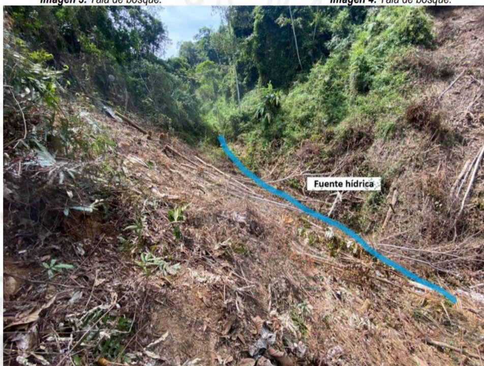
Imagen 4. Tala de bosque.