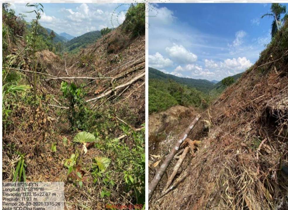
Imagen 6. Tala de bosque.