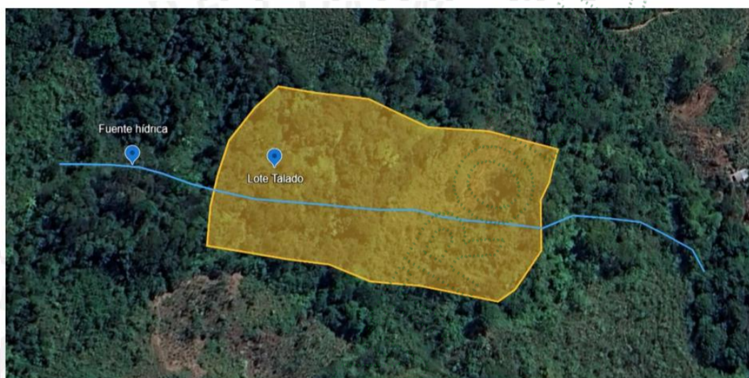
Imagen 2. Lote intervenido por tala de bosque

Las áreas circundantes al sitio donde se realizó la actividad están compuestas por algunos bosques nativos y rastrojos altos. Además, en la zona, se observan algunos cultivos de caña.