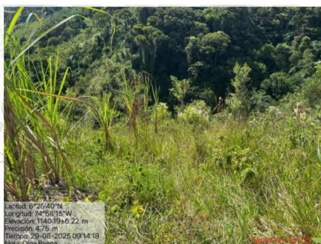
Imagen 3. Vista del lote desde la parte alta. Se evidencian fracciones de lote en cultivo de caña y otras en restauración.

Al indagar con algunas personas de la vereda se obtuvo que efectivamente las actividades de tala fueron suspendidas y que los cultivos de caña hacen parte de un sistema productivo compuesto por varios lotes de siembra y un trapiche, ubicados dentro del predio de la señora Olga Baena.