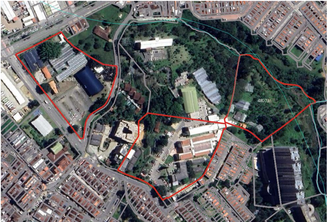
Imagen 1. Ubicación predios de interés

3.3 En cuanto a los individuos arbóreos de interés: Se encuentran dispersos al interior de las zonas verdes de la institución y vivero, son arboles que presentan condiciones estructurales regulares con inclinaciones de fuste y sistema radicular con anclaje regulares, otros presentan condiciones fitosanitarias regulares con procesos de secamiento y marchitez. Durante la visita se realizó un recorrido por el área a intervenir con el fin de identificar los árboles objeto de solicitud, se tomaron puntos de ubicación geográfica y se realizaron mediciones dasométricas para la elaboración del inventario forestal. Los arboles requeridos para aprovechamiento corresponden a: