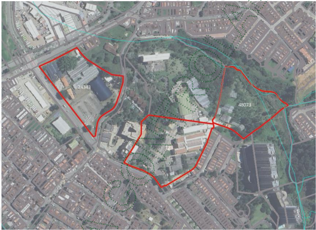
Imagen 2. Determinantes predios de interés

3.4 Localización de los árboles aislados a aprovechar con respecto a Acuerdos Corporativos y al Sistema de Información Ambiental Regional: De acuerdo con el Sistema de Información Geográfica de Cornare, el predio de interés se encuentra al interior de los límites del Plan de Ordenación y Manejo de la Cuenca Hidrográfica POMCA del Río Negro, aprobado en Cornare mediante la Resolución No. 112-7296 del 21 de diciembre de 2017 y mediante la Resolución No. 112-4795 del 8 de noviembre de 2018, estableció el régimen de usos, además, por medio de la resolución RE-04227-2022 del 1 de noviembre de 2022 se modifica el régimen de usos al interior. Obteniendo para la zona de interés: áreas urbanas.