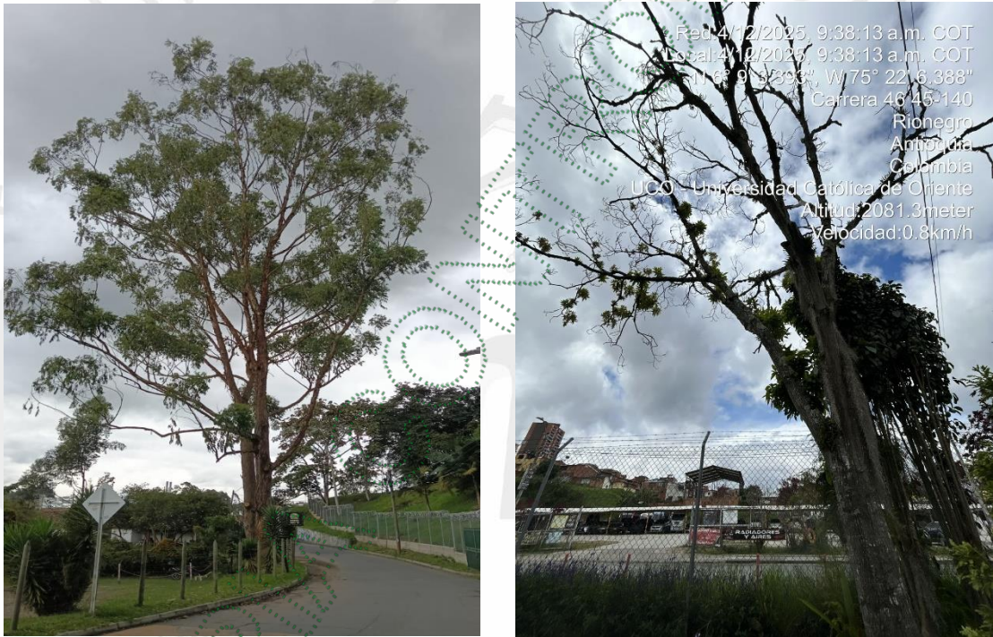
Imagen 3 y 4. Árboles a intervenir