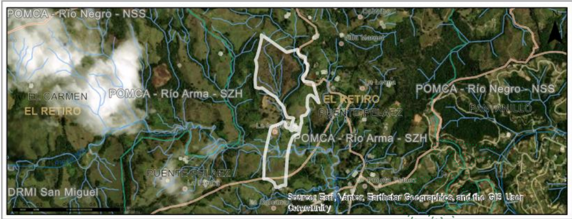
Imagen 1. Ubicación del predio de interés