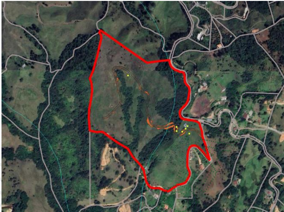
Imagen 2. Distribución de los árboles y trazo de la vía