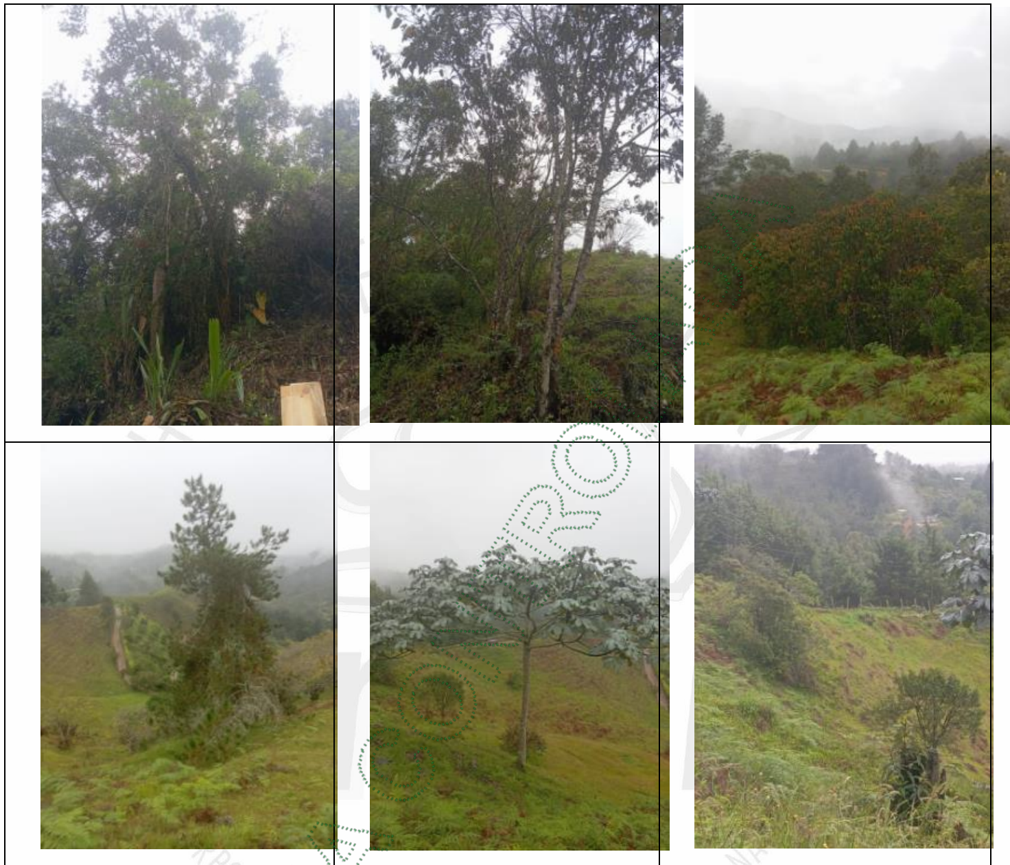
Imagen 3. Árboles objeto del aprovechamiento