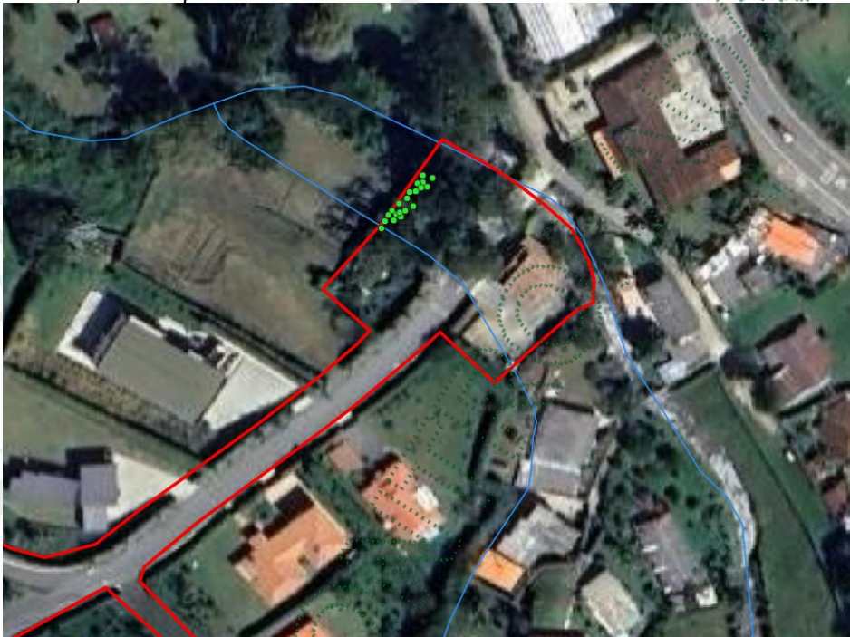
Localización de los árboles respecto al predio.

Estos árboles serán aprovechados por la necesidad de implementar unas unidades adicionales en el tren de tratamiento de las aguas residuales domésticas, previo a su descarga. En la Resolución RE-03056-2025 del 8 de agosto de 2025, la Corporación aprobó como tratamiento terciario el Humedal subsuperficial que será implementado.