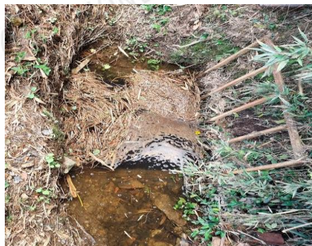
Imagen 3. Fuente proveniente de los predios Imagen 4. Entrada a tanque en la vía de la parte alta del sector.