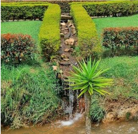
Imagen 5. Fuente que discurre por el predio. Imagen 6. Descarga de la Fuente a la Quebrada La Duenda.

Otras situaciones encontradas en la visita: N.A