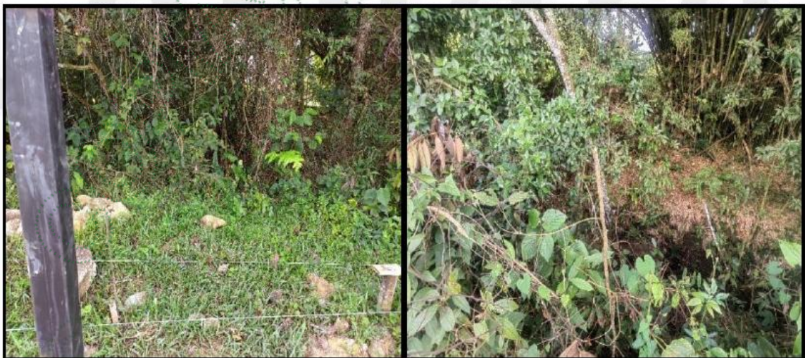
Imagen 3. Cornare. 2025. Cercanía de estructura metálica a la fuente hídrica y estado de cobertura vegetal de la fuente.