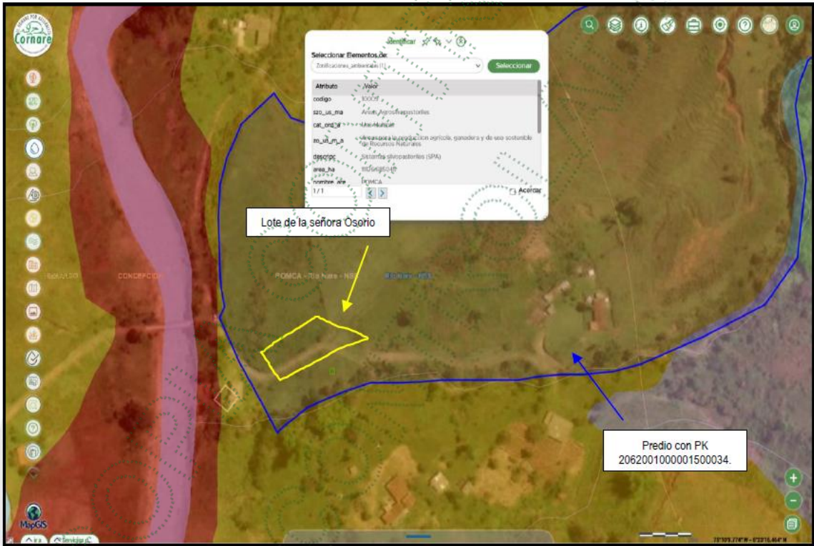
Imagen 3. MapGIS Cornare. 2025. Determinantes ambientales consultados para el predio con cédula catastral No. 2062001000001500034.