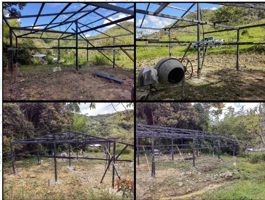
Imagen 1. Cornare. 2025. Levantamiento de estructura metálica y cimientos para construcción de vivienda en el lote de la señora Astrid Maryory Osorio.