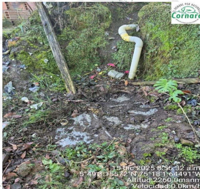
Imagen 3. Pozo séptico

Durante la visita se evidenció la presencia de un pozo séptico, el cual, según lo informado, es de fibra de vidrio. No se percibieron olores ofensivos o rupturas del sistema.