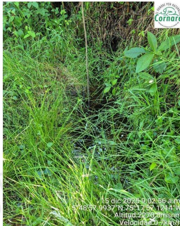
Imagen 2. Punto de captación.

Durante la visita se evidenció la presencia de un pozo séptico, el cual, según lo informado, es de fibra de vidrio. No se percibieron olores ofensivos o rupturas del sistema.