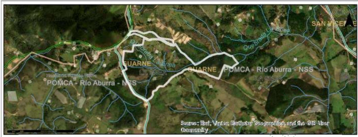
Imagen 1. Localización del polígono de predio 020-20072