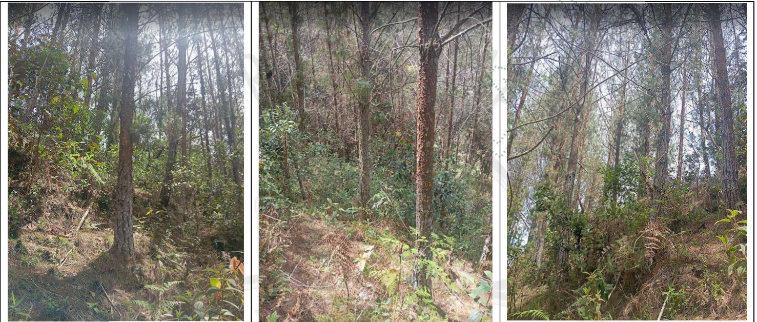
Imagen 4. Árboles plantados