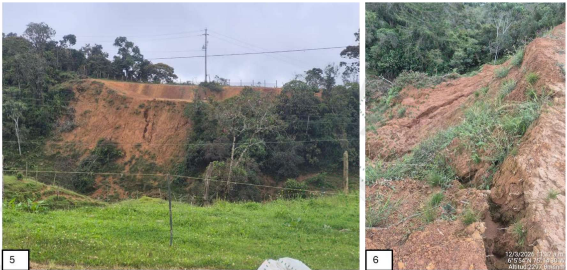
Imagen 5 y 6: Talud lateral con pendiente pronunciada y signos de inestabilidad.