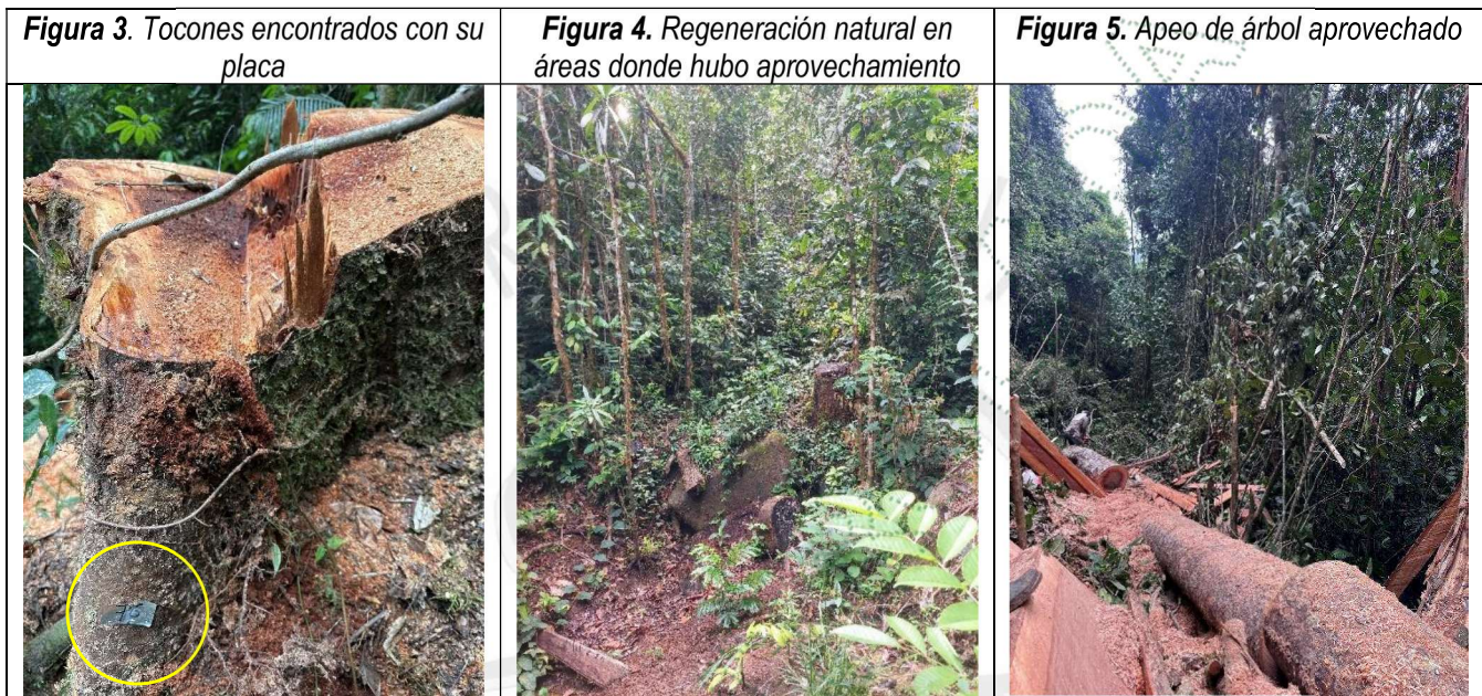
Tabla 3. Verificación de requerimientos

25.2 El aprovechamiento se encuentra activo ya que al momento de la visita se estaba realizando el apeo de un árbol aprovechado (Figura 5).