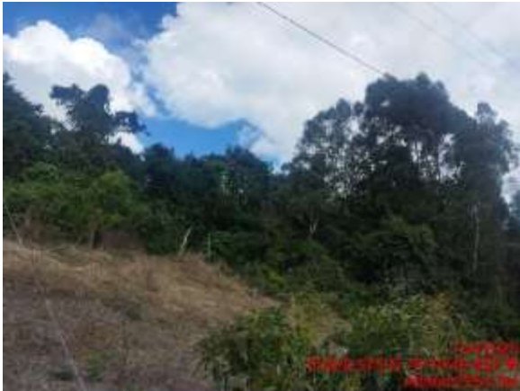
Área captación La Ramada 1