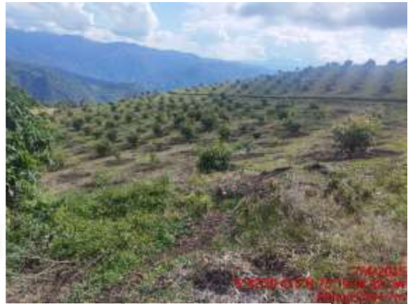
Panorámica del predio