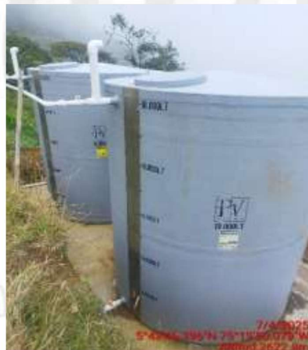
Tanques de almacenamiento