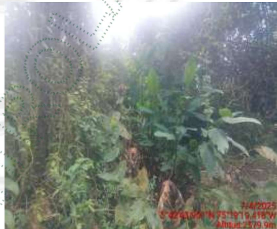
Área captación El Cebollal