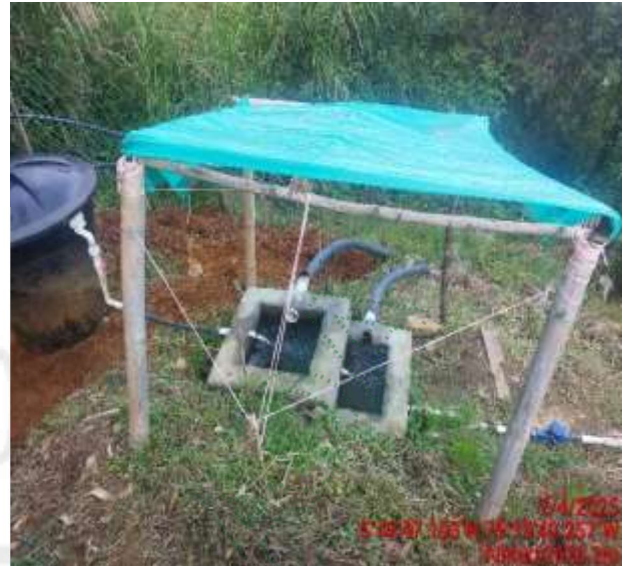
Zona captación La Ramada 1