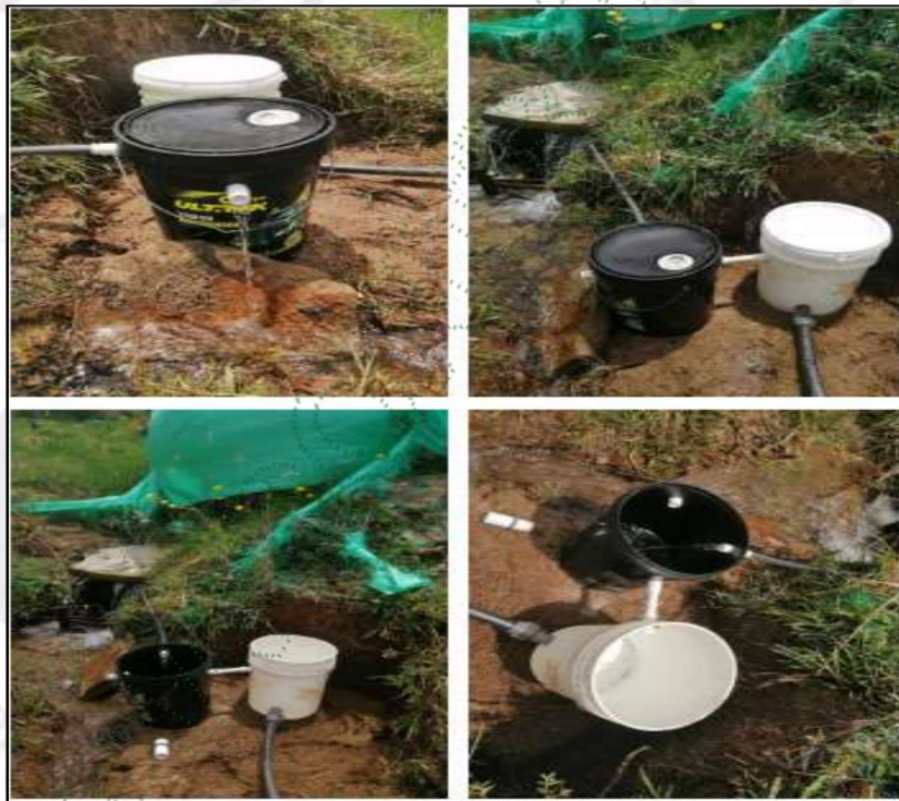
Ejemplo de obra control de caudal económica (diseño)