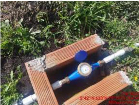
Micromedidor del predio