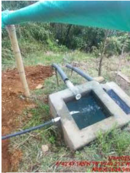
Zona captación La Ramada 1