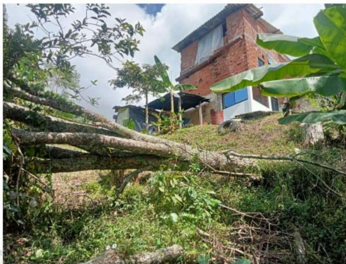
Imagen 2. Árbol talado sin su correspondiente manejo.

otorgados por la corporación y que actualmente se encuentra pendiente de gestionar su correcto aprovechamiento para uso de la madera en la misma propiedad y para realizar las actividades de compensación correspondientes, tal como se determinó en la resolución con radicado RE-03457-2025 por la cual se otorgó el permiso.