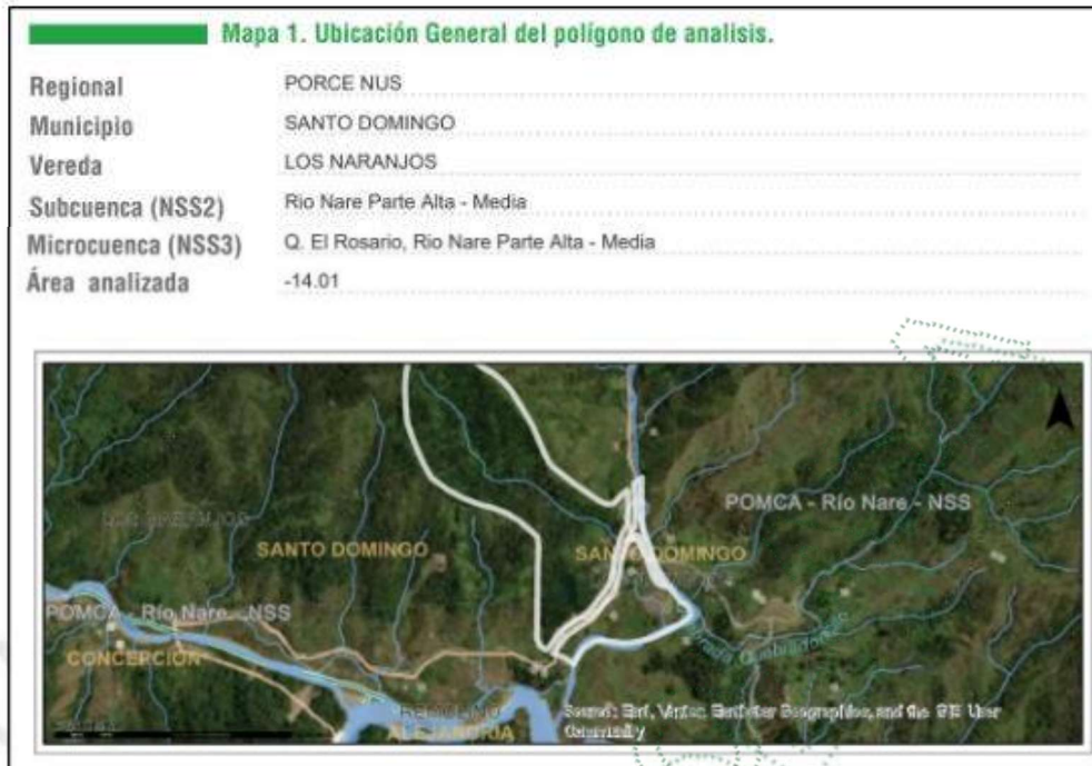
Imagen 1. MapGIS Cornare. 2026. Localización del predio con PK 6902001000000900003.