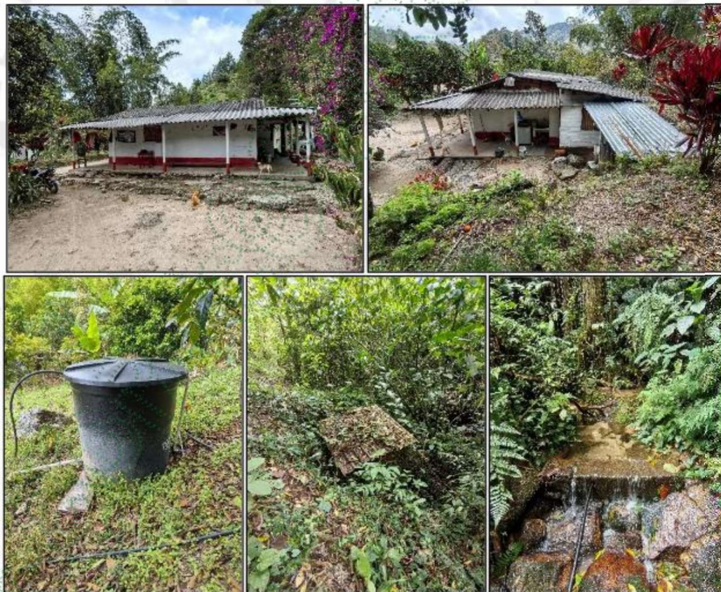
Imagen 2. MapGIS Cornare. 2026. Vivienda del señor Mauricio Moreno y sitio de captación.