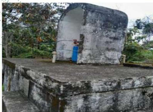
Imágenes de la obra de captación y tanque de almacenamiento existentes actualmente.