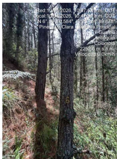
Imágenes 3 y 4. Árboles a intervenir