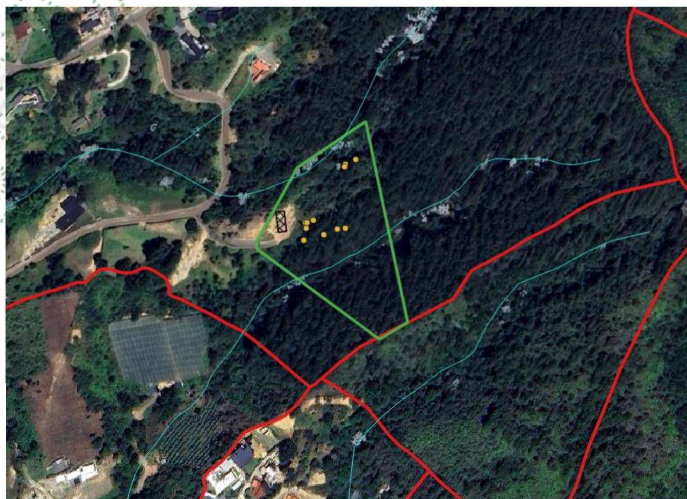
Imagen 1. Ubicación predio de interés

3.2 En cuanto al predio donde se ubican los árboles de interés: Se encuentra ubicado en la vereda La Clara del municipio de Guarne, presenta un paisaje de altiplanicie con un relieve de lomas y colinas, además, hace parte del polígono de parcelación conforme el POT del municipio. El objetivo del aprovechamiento es mitigar los riesgos frente a la vivienda futura, además, realizar un enriquecimiento con especies nativas.