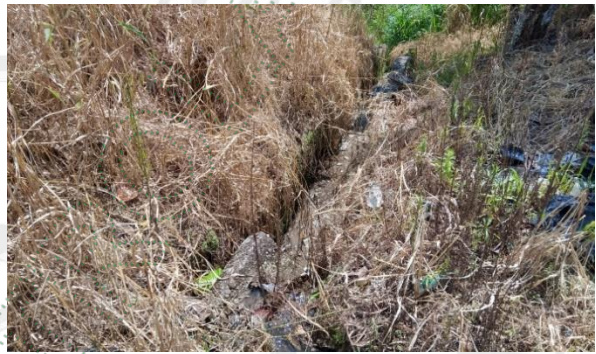
Conexiones de agua para lavado de carros y descarga de aguas.