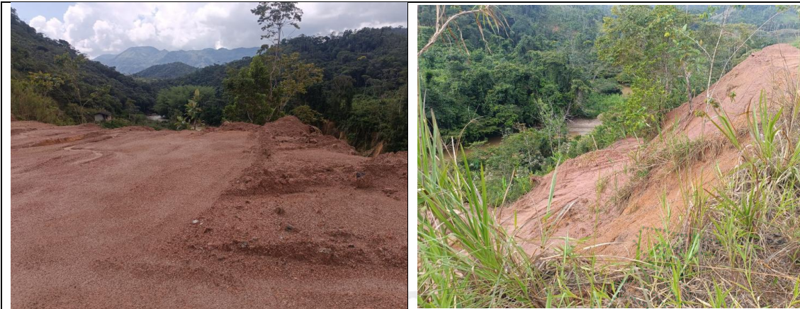
Imágenes 2,3,4 y 5 Estado actual del área intervenida